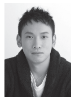
村松 崇継 (作曲家・ピアニスト)

1978年生まれ。5歳よりヤマハ音楽教室に通い、数々のジュニアオリジナルコンサート(JOC)に出演。国立音楽大学作曲学科卒業。これまでに50を超える映画、TVドラマ等の音楽を手掛ける。主な作品は、映画『クライマーズ・ハイ』、ジブリ映画『思い出のマーニー』など多数。2017年夏全国公開の新作アニメーション映画『メアリと魔女の花』の音楽を担当。映画『64-ロクヨン-前編』で、第40回日本アカデミー賞優秀音楽賞を受賞。